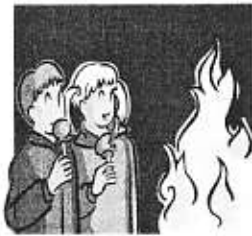
JOCUL COPILOR CU FOCUL

Exemplul celor mari cu privire la folosirea focului în prezența copiilor contează mult în educarea lor.