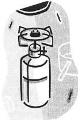
BUTELII DE GAZE LICHEFIATE / ARAGAZ

Se interzice folosirea buteliilor de gaze lichefiate fără regulatori (ceasuri) de presiune cu garnituri deteriorate ori cu furtunuri de cauciuc fisurate sau lărgite la capete.